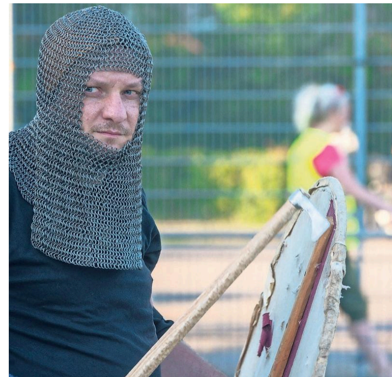
Een maliënkolder voor het hoofd.