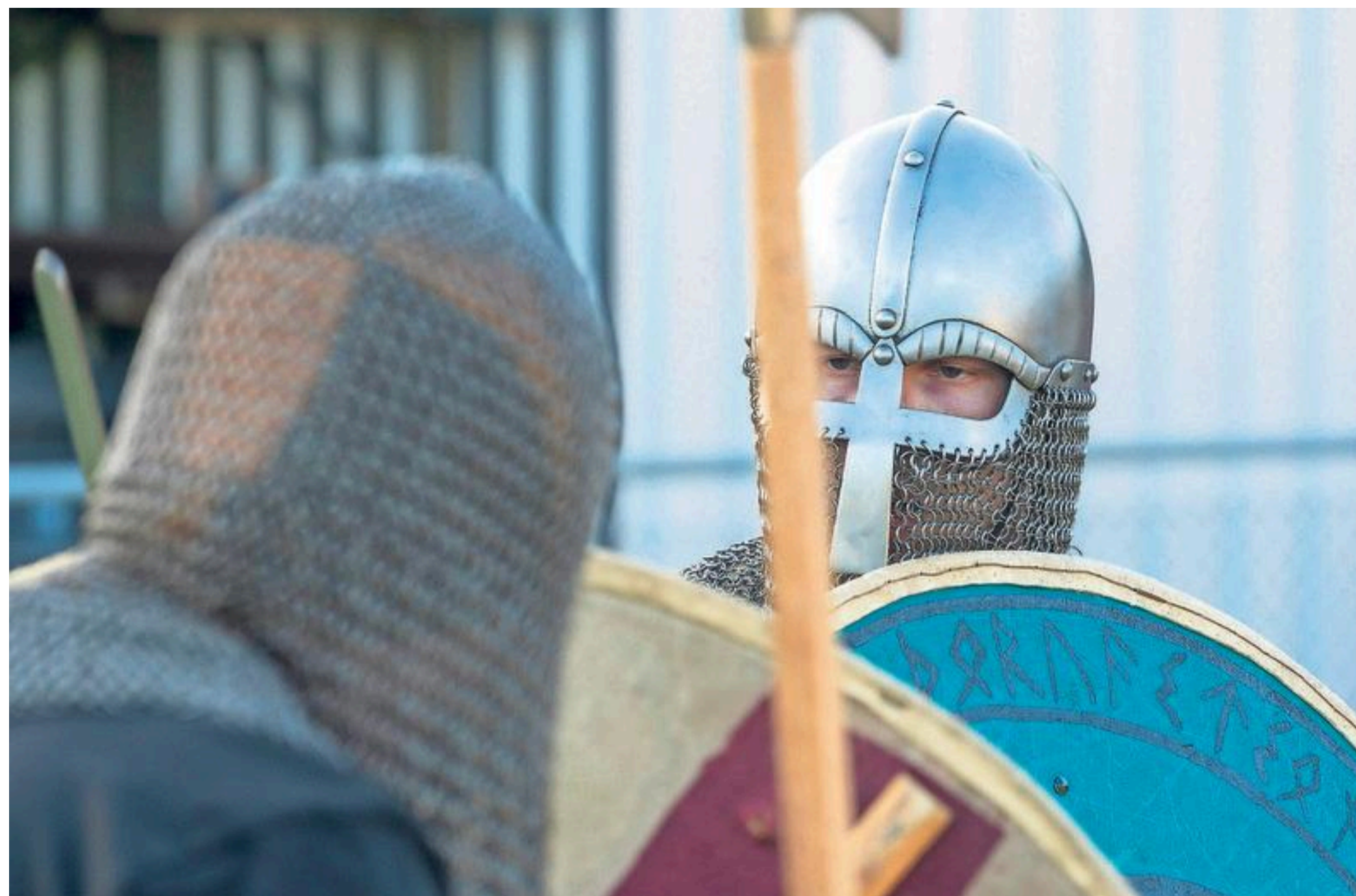
Twee leden van VaeV gaan het Vikinggevecht in vol ornaat aan.

„Bij het originele kostuum hoort ook een harnas. Dat gebruiken we