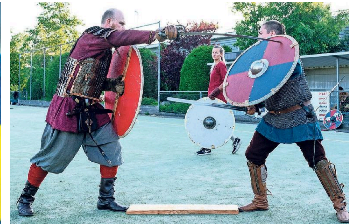
Strijd op het kunstgrasveld aan het Klaas Bootpad.